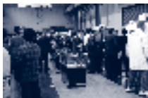
平成15年11月 ツガミテクニカルフェア

平成15年6月と11月に長岡工場において「ツガミテクニカルフェア」を開催し、最新の機械や技術をアピールするとともに、取引先の開拓を積極的に進めて参りました。